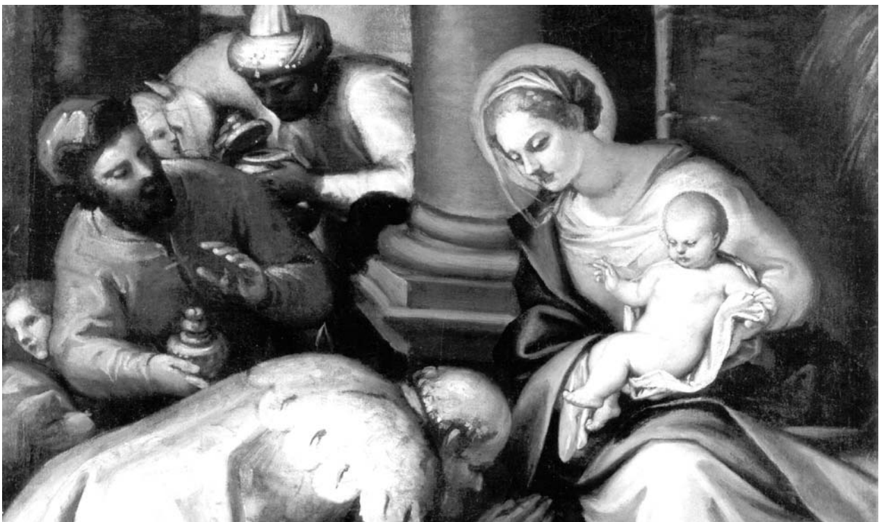
L'Adorazione dei Magi (particolare).