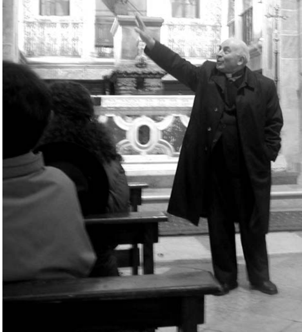
Monsignor Dalla Caneva mentre svolge il suo ruolo di cercatore per uno dei tanti gruppi di pellegrini.