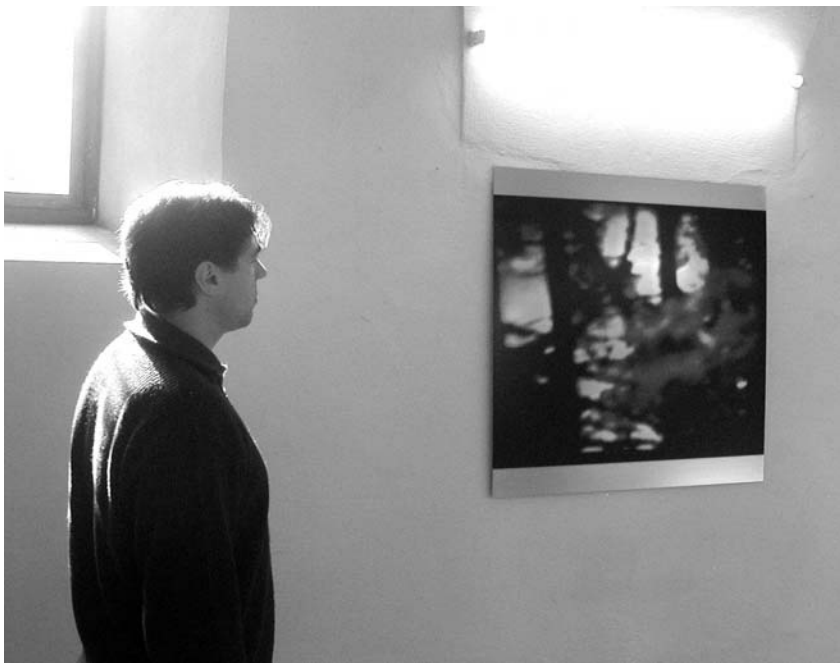
Un visitatore di fronte a un'opera della mostra Caminantes .