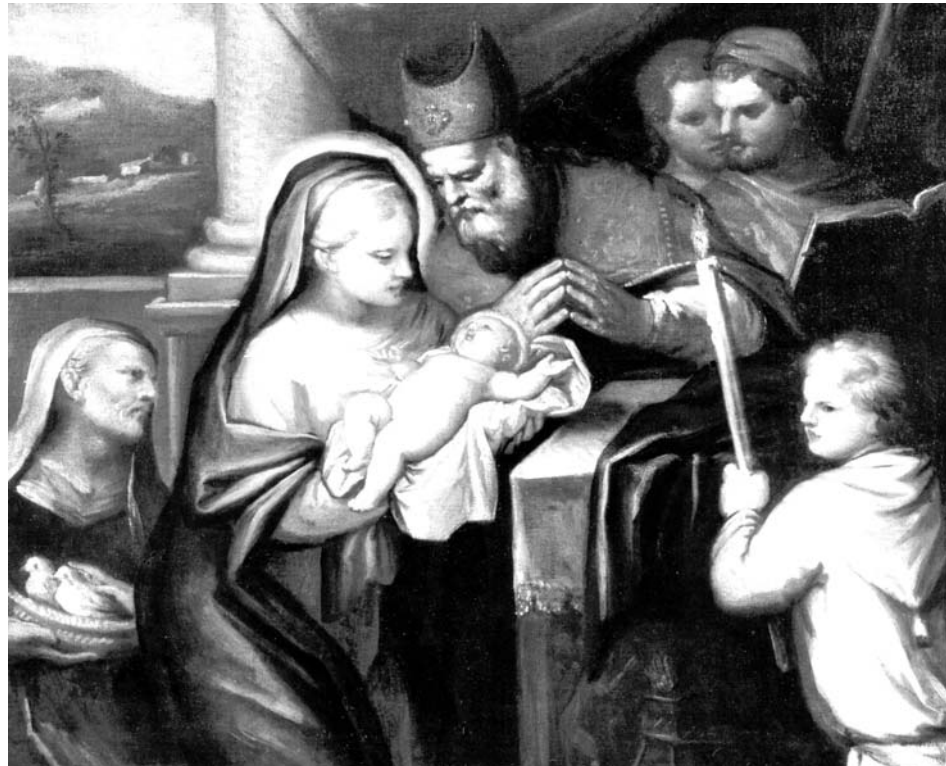
La presentazione al Tempio.

Il Santuario dei Santi Vittore e Corona mutò aspetto nella seconda metà del Seicento quando al suo governo furono destinati i padri Somaschi. Nella chiesa furono