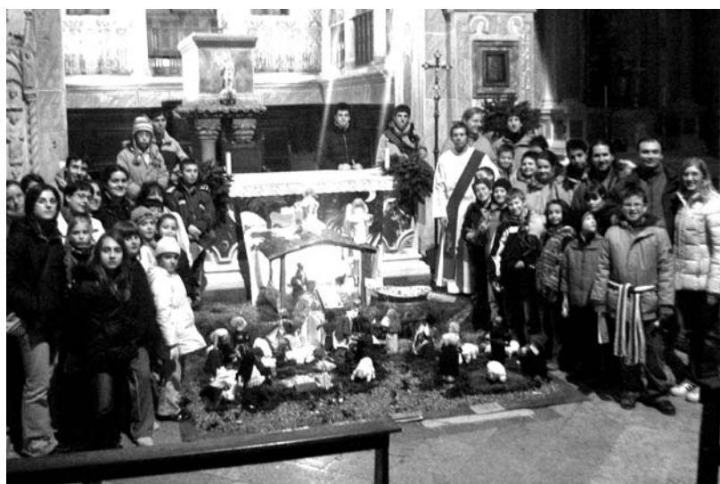
Foto di gruppo attorno al presepio appena ultimato.