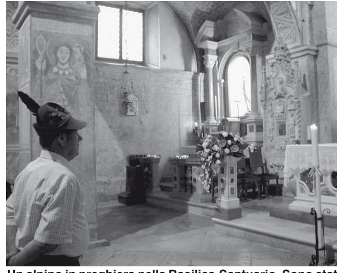
Un alpino in preghiera nella Basilica-Santuario. Sono stati molti i momenti di commozione al ricordo degli avvenimenti che hanno coinvolto molti Alpini della prima e della seconda guerra mondiale.