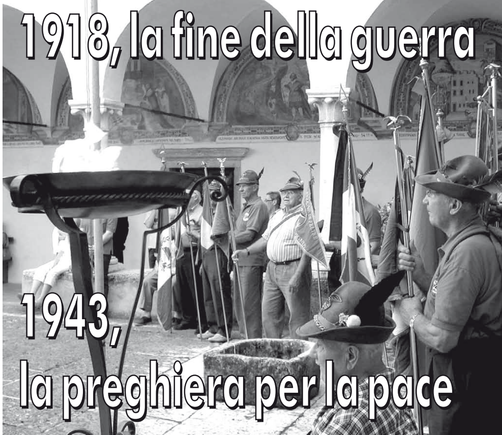
CHIOSTRO - I gagliardetti dell'Ana feltrina partecipano alla commemorazione del novantesimo della prima guerra mondiale e del 65esimo della prima grande processione per la pace celebrata a Feltre.

grande rispetto che si doveva a monsignor Cattarossi, oramai negli ultimi mesi di vita - sarebbe morto nel 1944, ndr - che dissuase le autorità civili, fedeli al regime di Mussolini, dal boicottare la celebrazione». Fu in quell'occasione che si compì la prima ricognizione delle reliquie mai av-