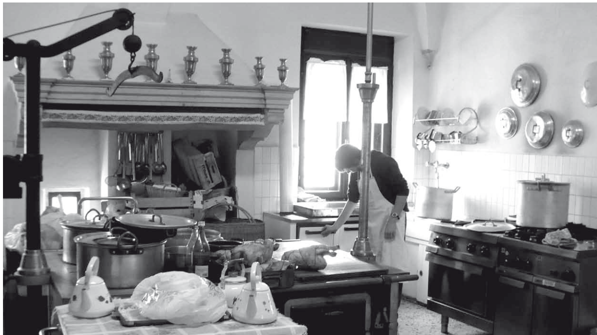
SANTUARIO - La cucina della Casa esercizi è un luogo caro a moltissimi per l'ospitalità che vi regna, grazie al Rettore e al personale. Come conciliare l'aura quasi sacrale che vi si respira con le nuove tecnologie? È il compito dei progetti affidati all'architetto Peregò.

A queste difficoltà, che si presentano comunemente nel momento in cui si voglia rifunzionizzare un luogo per trasformarlo, poco o tanto, in qualcosa di diverso, si è aggiunta la necessità, direi l'urgenza, di un consono approvvigionamento energetico, che fosse anch'esso in