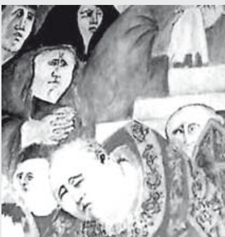
L'affresco di Vico Calabrò (particolare) nella ex-sagrestia, ora segreteria.

20 giugno 1943: una data per ricordare lo storico avvenimento che ha visto le genti feltrine, e non solo, affidarsi alla intercessione dei santi martiri «nell'infuriare della guerra mondiale, per implorare la pace e il ritorno dei dispersi in Russia» e dai vari campi di battaglia. Un avvenimento, forse il primo in Italia, ricordato dal significativo affresco del pittore Vico Calabrò che ha suggerito il pellegrinaggio annuale da san Vittore alla Madonna del Grappa e la suggestiva mostra fotografica dal titolo Ventimila voci per la pace . Nel 65esimo anniversario si sono rinnovate le invocazioni per chiedere pace e serenità nelle famiglie nella Chiesa e nel mondo.