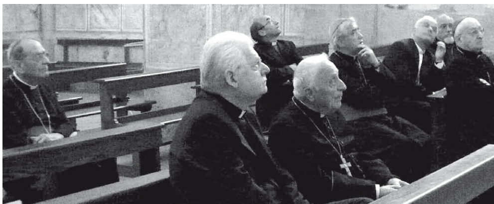
Nell'aula del Santuario, i Vescovi del Triveneto, con il patriarca di Venezia cardinale Angelo Scola, ascoltano la spiegazione degli affreschi nelle navate. La visita al santuario - nel pomeriggio i Vescovi si sono recati a Canale d'Agordo per la Santa Messa presieduta dal patriarca nel 30esimo anniversario dell'elezione di Giovanni Paolo I a sommo pontefice - è stata organizzata anche in seguito alla Lettera dell'episcopato triveneto sugli esercizi spirituali. La cura della spiritualità e la proposta degli Esercizi vuole essere uno degli scopi del complesso del Santuario.