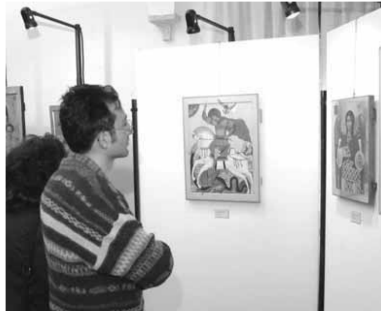
Una mostra di icone in santuario.

Un'iniziativa ispirata dalla storia del santuario: i temi di fondo sono il martirio, il dialogo tra la Chiesa occidentale e quella orientale, il ruolo della donna nella cultura. Per il periodo 2007-2009 si aggiunge il tema del pellegrinaggio: a Roma, a Gerusalemme, a Santiago.