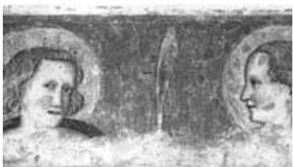
I santi Vittore e Corona.

Le reliquie dei santi Vittore e Corona, patroni di Feltre (celebrati il 14 maggio), portate in salvo, nel 205, dalla Siria a Cipro da san Teodoro, giunsero nella laguna veneta tra il IX e il X secolo, nel periodo in cui, a causa delle pressioni musulmane sull'isola di Cipro, vennero traslati anche i corpi di altri santi. In seguito, verosimilmente attorno alla metà dell'XI secolo, le sante reliquie passarono a Feltre dove, per custodirle e venerarle, fu eretto lo splendido santuario sul monte Miesna, in località Anzù (M. Perale, L'Alto Medioevo nella provincia di Belluno ). Fu consacrato il 13 maggio 1101 e venne fondato da Giovanni da Vidor, ricordato nell'iscrizione del 1096, posta sotto il suo sarcofago dal figlio Arpone, vescovo di Feltre. Fin dal XIII, parteciparono alla decorazione dell'edificio numerose botteghe di pittori, tra i quali ricordiamo il "Compagno di Tomaso o Maestro di San Vittore", un artista seguace di Tomaso da Modena, al quale sono ascrivibili le Teste dei Santi Vittore e Corona , sul pilastro a destra dell'abside (frammento di una più ampia rappresen-