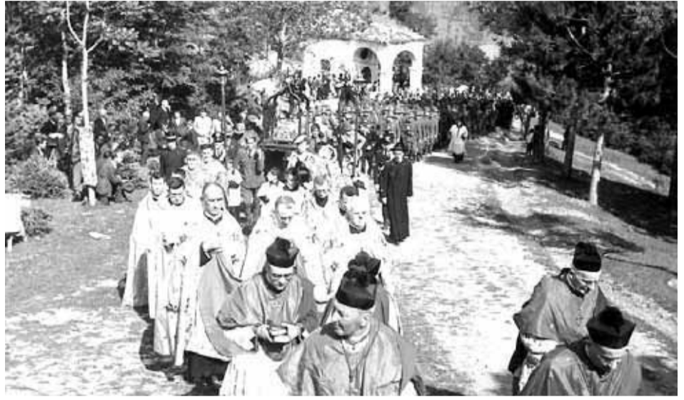
SANTUARIO DI SAN VITTORE - La folla raggiunge il santuario nella grande preghiera del 1943. Nella foto a destra, si intravede l'arca con le reliquie dei santi martiri.

Il foglio parrocchiale di Lamon, nato nel 1924, racchiude frammenti di storia locale ricchi di fatti e di eventi che ci raccontano chi eravamo, quali drammi abbiamo vissuto, quante difficoltà costellavano la vita quotidiana nel secolo scorso.