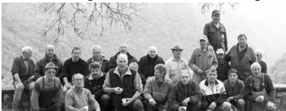
I volontari sul muretto alle spalle del Santuario in un momento di pausa.

Il Team ecologico diocesano voluto da monsignor Loris Susanetto