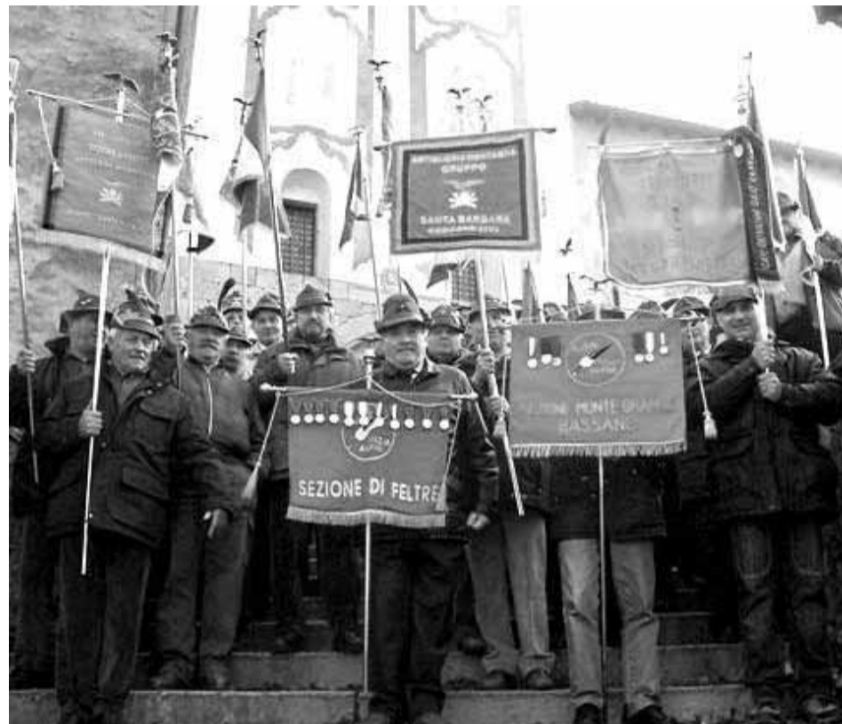
SANTUARIO - Il 2 febbraio, visita del gruppo Artiglieri ed ex artiglieri del Feltrino.

un Gruppo famiglie di Mogliano Veneto e quindi, il 16 febbraio, un gruppo di scout del Masci (Movimento adulti scout cattolici italiani) provenienti da tutta la Regione. Scout anche il 17 febbraio, questa volta, da Trieste, mentre il 23 febbraio una rappresentanza trentina del Wwf è guidata dall'associazione "La Fenice" nella visita alla Rocca. Il primo marzo e il giorno successivo piantano le tende 80 scout di Zelarino e Trivignano. Da Padova, il 9 marzo, un gruppo di visitatori e pellegrini, mentre gli alunni della scuola elementare di Arsiese sono al santuario venerdì 14 marzo. Il 15 marzo è la volta dei Giovani ungheresi della città gemellata con Feltre e dei ragazzi del catechismo della parrocchia di san Giovanni evangelista a Mestre. Il 24 marzo arriva la parrocchia di Cologne, in provincia di Brescia. Il 25 marzo invece salgono al santuario i cresimandi di Rocca Pietore, Caprile e Colle Santa Lucia. Alcuni visitatori tedeschi sono a venerare san Vittore il giorno successivo, il 26 marzo, mentre l'8 aprile ci sono i ragazzi della Scuola secondaria di primo grado di