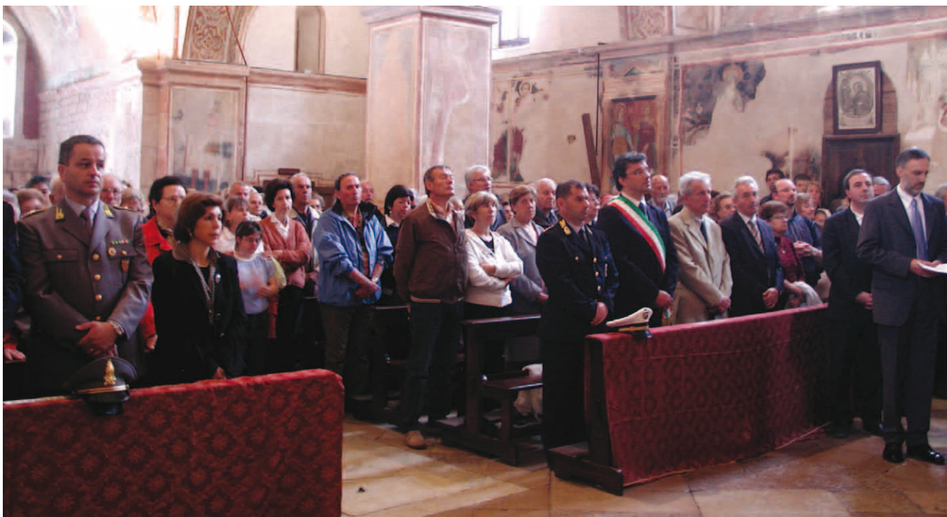
SANTUARIO - Fedeli e autorità, numerosi come ogni anno, presenti alla Santa Messa del 14 maggio.

«Non serve sprecare parole sulle difficoltà economiche che rendono quest'anno molto difficile per tutte le iniziative. Stiamo aspettando delle risposte da due enti prima di divulgare un programma ambizioso che vede ben tre concerti, di cui uno inserito nella settimana dedicata al corso di Canto gregoriano, dal 31 agosto al 5 settembre. Ci sarà poi la mostra "Sulla via di Damasco", che sta circuitando per l'Italia, partita da Roma».