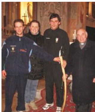
La tappa al Santuario del bastone del pellegrino.

Martedì 23 dicembre 2008 alle ore 22 il Bastone del pellegrino e del cittadino è stato accolto dal rettore monsignor Secondo Dalla Caneva nella basilica-santuario sul monte Miesna. A portarlo una staffetta podistica degli arbitri di calcio della sezione Aia di Belluno, partiti dalla casa di preghiera «San Girolamo Miani» di Castelnuovo di Quero. Il cammino del bastone, iniziato la sera di Pasqua del 2008, si è snodato lungo tutta la penisola: 350 tappe giornaliere per oltre 5000 Km, tutti a piedi. Oltre 100.000