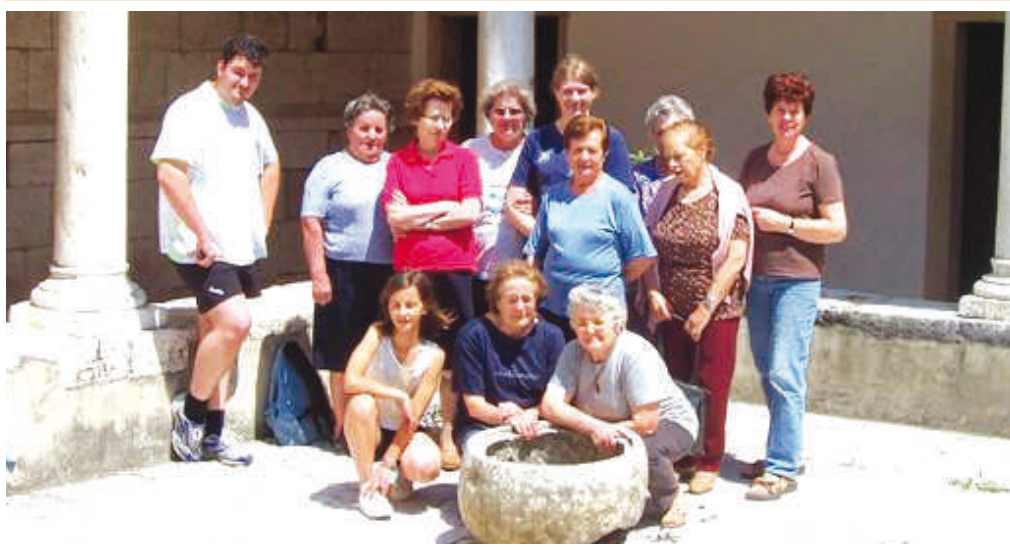
Una foto ricordo del gruppo delle volontarie che hanno riassetato la Casa esercizi in occasione della pausa estiva dei lavori di ristrutturazione, in modo da renderla il più possibile confortevole. Un grazie alle volontarie anche da queste colonne.