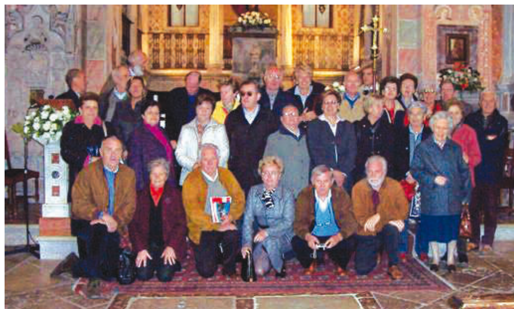
Foto di gruppo del 2008 per il ritrovo spirituale annuale del Gruppo amici "Don Feltrin" a San Vittore. Il gruppo si ritroverà nella Casa esercizi l'11 e il 12 ottobre per la sesta giornata di spiritualità.

COMUNI di SOSPIROLO, SEDICO e SANTA GIUSTINA