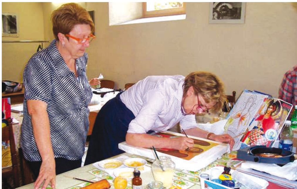
I corsi di iconografia si sono svolti quest'anno presso la Casa esercizi dal 12 luglio al 2 agosto. Partecipanti di ogni età e condizione, anche alcune monache di clausura.