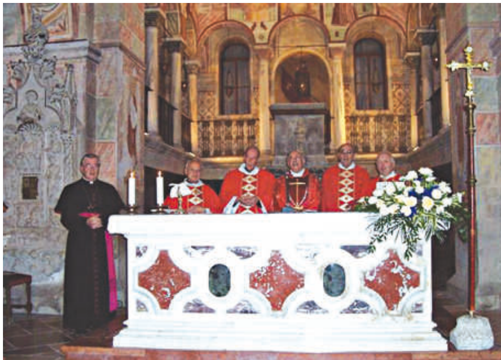
SANTUARIO - Il Vescovo ha partecipato, lo scorso 18 settembre, alla Santa Messa per san Vettorèt presieduta da monsignor Secondo Dalla Caneva e concelebrata da alcuni canonici del Capitolo della Concattedrale.