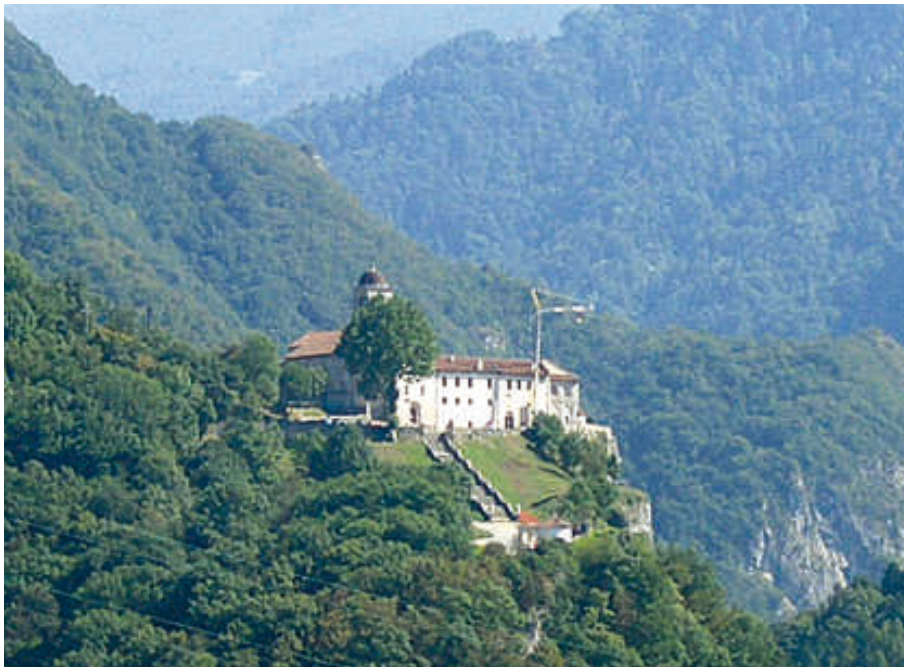
Il santuario visto dal Telva. La presenza dell'impresa edile con la gru indica il protrarsi dei lavori alla Casa esercizi.

Tutti gli incontri iniziano con la messa alle 9 e si concludono alle 12. È possibile fermarsi per il pranzo, prenotando all' arrivo. È bene preavvisare la casa della partecipazione, soprattutto nel caso degli incontri per fidanzati finalizzati al matrimonio (telefono 0439 2115).