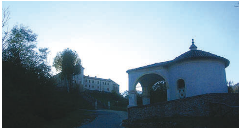
Il santuario con il capitello dell'Angelo visto dall'arrivo del sentiero dei pellegrini, avvolto nella luce mattutina.

vera e propria, di ben otto pagine, a firma di Gianpaolo Trevisan. Ecco alcune delle sue affermazioni più signifi-