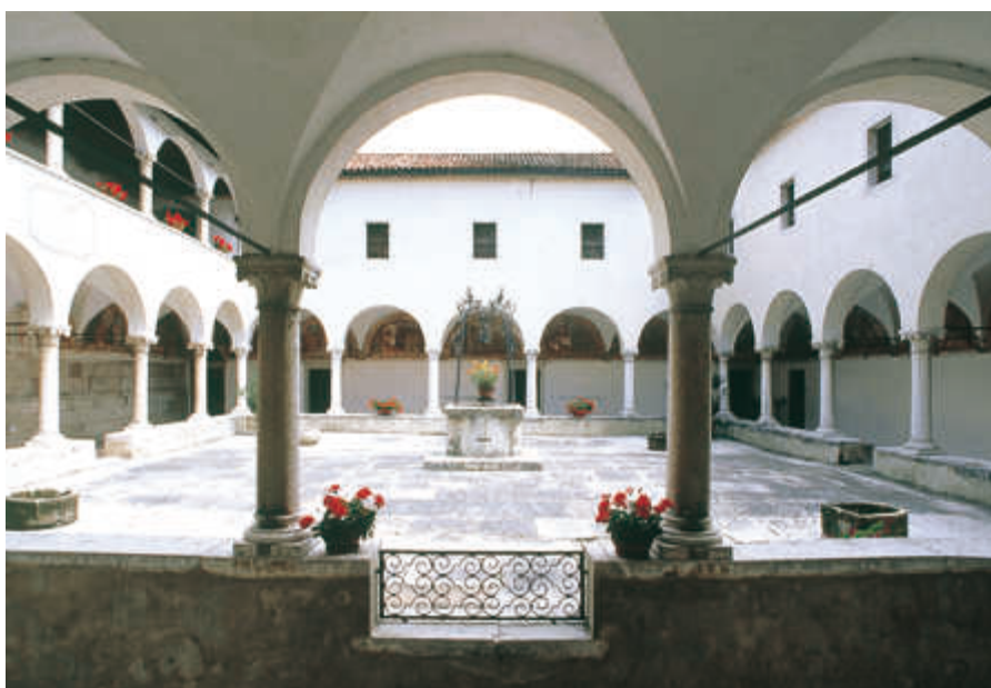
Il chiostro di san Vittore.

Molti esprimono stupore e ammirazione per la bellezza del luogo. Ecco una testimonianza, tra le tante: «Sono rimasto entusiasta di questo Santuario. Passo per questa strada da 30 anni, guardavo sempre in alto, ma non sapevo cosa fosse, che storia ci fosse. Oggi degli amici che hanno festeggiato il loro cinquantesimo di matrimonio ci hanno accompagnato ed abbiamo contemplato tutta la grande bellezza che Dio ci dà». Una visitatrice esclama, ovviamente rivolta a Dio: «Come non lodarTi davanti a tanta stupenda bellezza». Un altro si augura «che questo santuario che tanto ha visto nella storia dell'uomo e che tanta saggezza ha divulgato ai suoi visitatori, sia portatore di chiarezza nelle idee e nei cuori». Fa piacere leggere anche «un