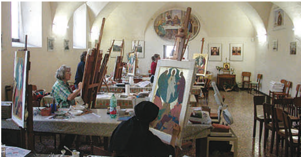
Uno dei corsi di iconografia che si tengono d'estate in santuario.