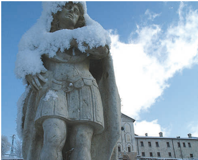
Veduta invernale del san Vittore ai piedi della scalinata.

Sull'ultimo numero di «Se- gnoPer», mensile dell'Azione cattolica italiana, c'è un ar- ticolo dell'assistente degli adulti, monsignor Uto Ughi, intitolato «La cella interiore»